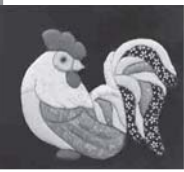
会員が作った木目込み人形(左)と、干支の飾り(右)