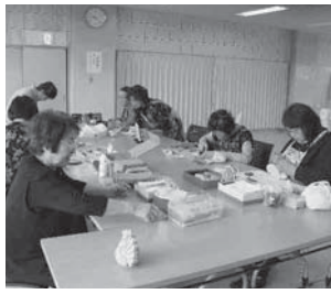
おしゃべりしながら、楽しく制作しています

「木目込人形ふくろうの会」は平成15年に結成。大曲会館で毎週火曜の午前9時から和気あいあいと活動しています。現在会員数は8人です。