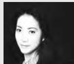
諏訪内晶子

入場料 全席指定/前売り・当日とも ●一般 4,500円 ●高校生以下 2,500円 チケット発売 4月15日 午前10時か ら (地区図書室の受け付けは4月16日 から)