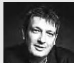
ボリス・ベ レゾフスキー