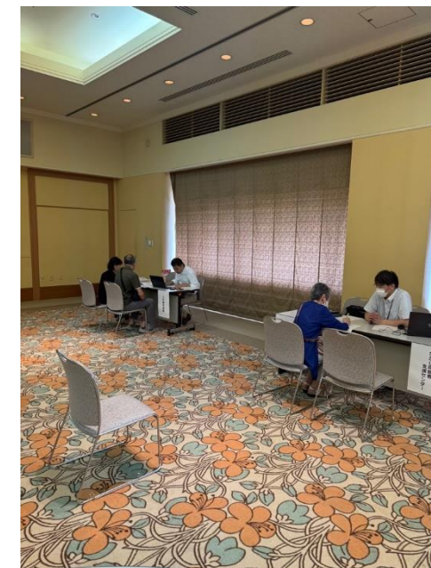
住まいの相談会の様子