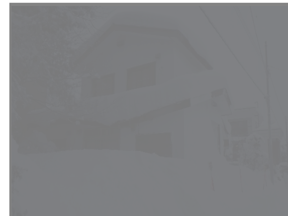
令和4年8月：緊急安全措置実施前（左）、令和6年1月：現況（右）