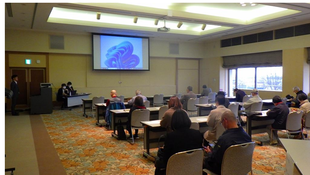
令和5年度第1回の様子