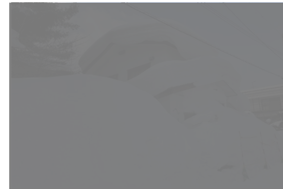
平成30年9月：特定空き家認定時（左）、令和4年2月：緊急安全措置実施前（右）