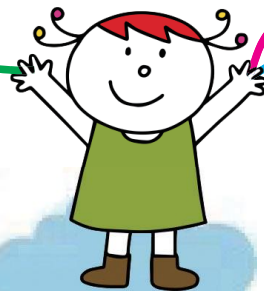
おおぞらひろば (4階)