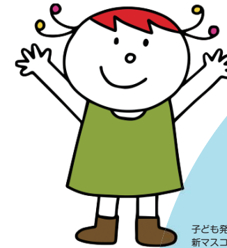
子ども発達支援センター 新マスコットキャラクター