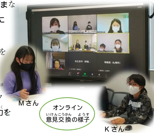
オンライン 意見交換の様子

北広島から参加した2人も 自然の豊かさやボールパーク の建設など、北広島市の魅力を それぞれに発表しました。