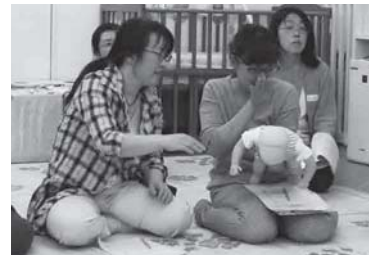
問合せ 健康推進課 (内線808)

慌てず、背中の中を力強く数回連続してたたき、異物を吐き出させます。この時、頭側は低くしてください。先のとがったものや電池などを飲み込んだ場合は注意。すぐに病院などへ相談してください。