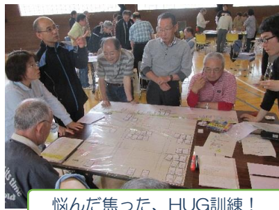
悩んだ焦った、HUG訓練！