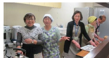
市民スタッフの笑顔に癒されます♥

・平成25年9月からスタートした週1回だった喫茶の営業は、現在週3回（月・水・金）の営業となりました。ともにで生活されている方々と地域の方々との交流が始まり、ともにの喫茶が地域における交流の場としての役割を担っております。