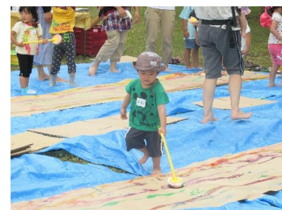
お外で絵具だらけになりました♪