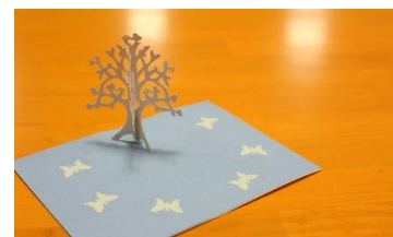
夏休み自由研究講座を企画中♪