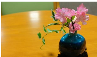
いたるところに綺麗な花が♪