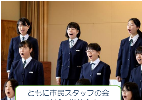
ともに市民スタッフの会 地域の学芸会！

・今年度からともに市民スタッフの企画イベント（民謡コンサート、地域の学芸会、石狩振興局と共催した地域の運動会）が開催されました。又、毎月1回「第4住区地域のお茶の間」と連携して、お茶会を中心に各種講座、コンサート、体操などを開催しています。地域の方々と、ともに生活している方々が一緒に盛り上がり世代を超えて交流を図っています。