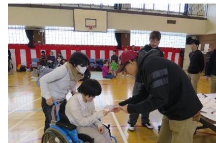
地域の運動会 若さみなぎる道都大学生と一緒に！