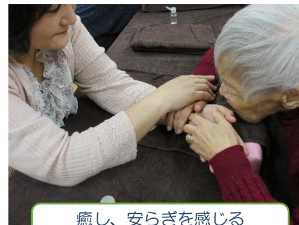
癒し、安らぎを感じる ハンドマッサージ♪

・活動室、体育館をご利用の団体へ「ともにメンバー会員制度」（会員は利用料50%になる代わりに、ボランティア活動を実施する）を創設。「ともに」を拠点にボランティア活動していただくと共に、団体間の世代・障がいを越えた交流を促す取り組みです。