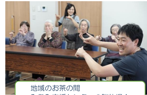
地域のお茶の間 みなみ支援センターの脳体操！