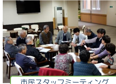
市民スタッフミーティング