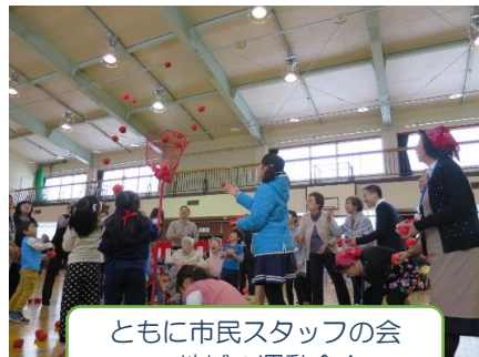
ともに市民スタッフの会 地域の運動会！