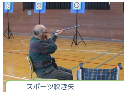
スポーツ吹き矢 呼吸法が健康の秘訣です♪