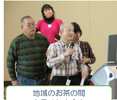
地域のお茶の間 カラオケ大会！