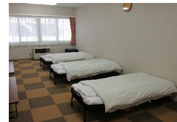
活動室が落ち着く宿に早変わり♪