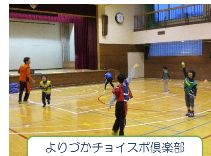
よりづかチョイスポ倶楽部 ジュニアスポーツ塾