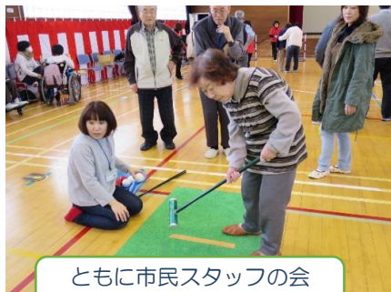
ともに市民スタッフの会 地域の運動会！