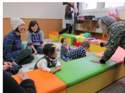
まーぶるひろば 世代を超えた楽しい交流♪

・グラウンドで子育て世代を対象とした講座が開催されました。子供たちは絵の具まみれになりながら自由に遊びました。