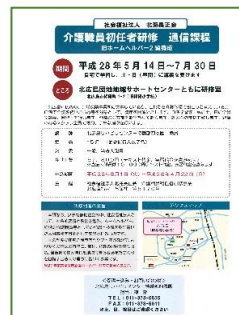
介護職員初任者研修