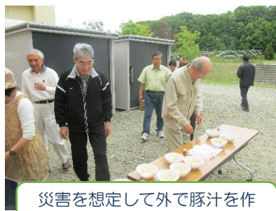
災害を想定して外で豚汁を作りました！