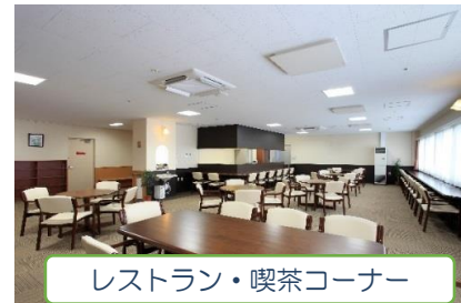
レストラン・喫茶コーナー