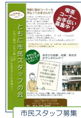
市民スタッフ募集