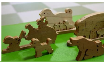
木の温もりが伝わってきます♪