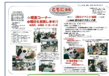
ともに通信 毎月発行