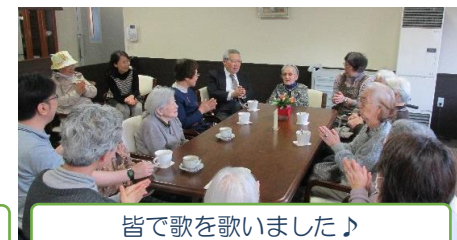
皆で歌を歌いました♪