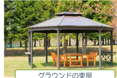
グラウンドの東屋