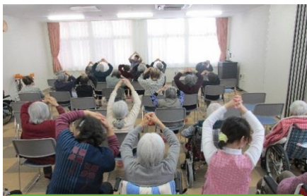
ともに健康体操 毎週（水・土）開催中です！