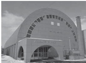
西の里ファミリー体育館の大規模改修