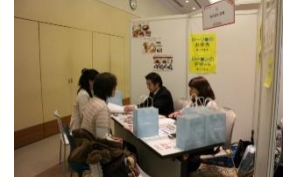
↑ 様子 ← 平成29年度のチラシ