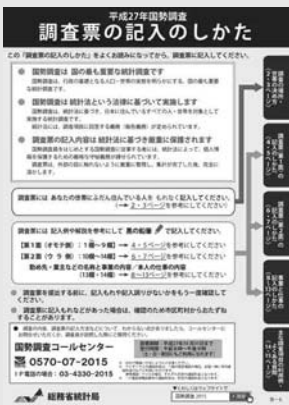
調査票の記入のしかた