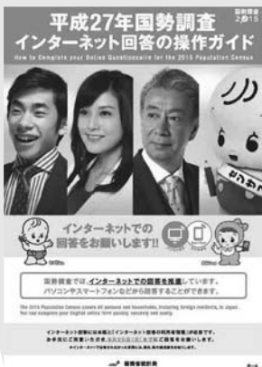
インターネット回答の操作ガイド