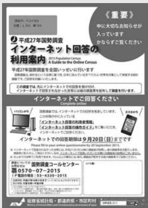
インターネット回答の利用案内