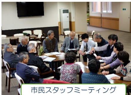
市民スタッフミーティング