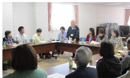
北広島市自立支援ボランティア講習 受講者との、四恩園見学交流会