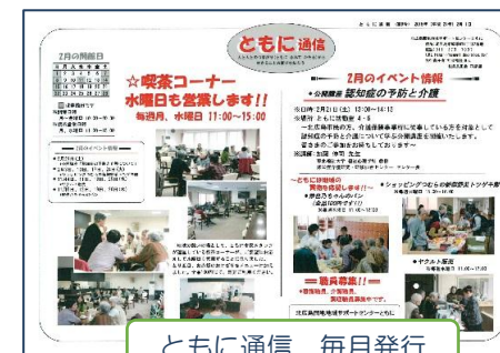
ともに通信 毎月発行