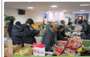
ショッピングつむら新鮮野菜とつけき隊