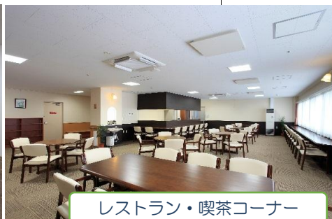
レストラン・喫茶コーナー