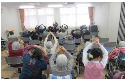
ともに健康体操 毎週（水・土）開催中です！

・体育館、グラウンドは、各種サークル団体、スポーツ少年団、障がい者団体、地域の小学生（放課後利用）などが、市内外から利用されています。 ・毎週2回（水・土）とともに生活されている方々を対象に介護予防体操を実施していますが、今後は地域の方々も参加頂けるように企画中です。