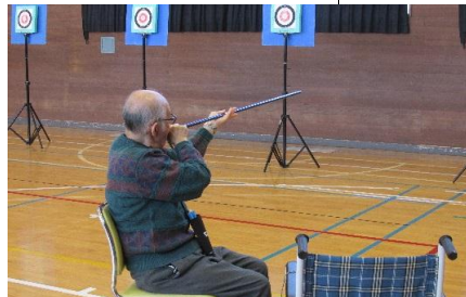
スポーツ吹き矢 呼吸法が健康の秘訣です♪