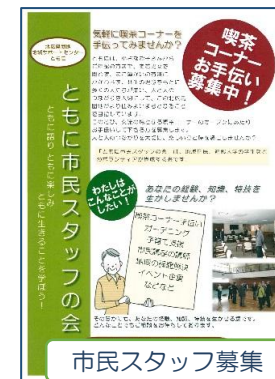
市民スタッフ募集