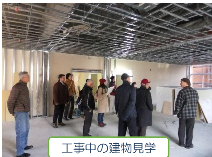
工事中の建物見学

・平成25年12月（オープンの4ヶ月前）から、地域の方々と共に「ともに市民スタッフの会」を立ち上げ、地域のつながり、支え合いのために、「ともに」を拠点として何ができるのかを話し合ってきました。オープンセレモニーの企画・実施も行い約700名もの来場がありました。また、平成25年9月から喫茶コーナーをオープンし、地域の方々も多数来場いただいています。