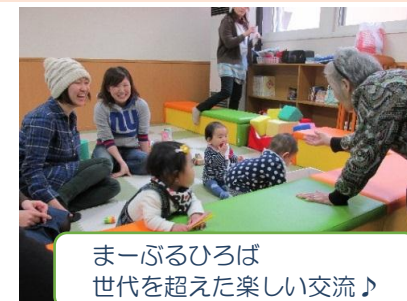
まーぶるひろば 世代を超えた楽しい交流♪

・キッズコーナーでは、地域の子育て世代が遊びに來たり、奇数月に子育て支援センターと連携して出張保育（まーぶるひろば）を実施しています。