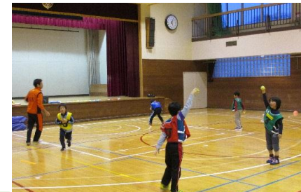
よりづかチョイスポ倶楽部 ジュニアスポーツ塾