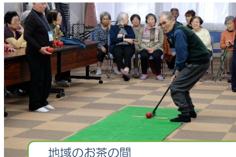
地域のお茶の間 スカットボールで楽しく健康に！

・毎月1回（土）活動室にて、「第4住区地域のお茶の間」と連携して、お茶会を中心に、各種講座、コンサート、体操などを開催しています。地域の方々、ともに生活している方々が一緒に盛り上がり交流を図っています。