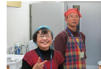
市民スタッフの笑顔に癒されます♥