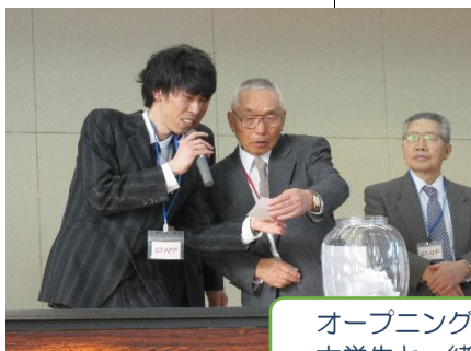
オープニングセレモニー 大学生と一緒に司会進行