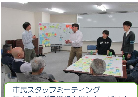
市民スタッフミーティング 若さみなぎる道都大学生と一緒に！