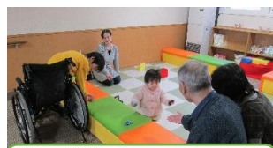
子供がみんなを笑顔に一つにつなげます

・現在3つの販売業者の協力を得て、ともに内で移動販売を行っています。地域の方々にも徐々に浸透しており、住みよい地域づくりに今後も貢献していきます。 ・継続的地域協議を契機に、地域の課題解決にむけて、地域の方々や社会資源と連携しながら住み良い楽しい地域をつくりまします。