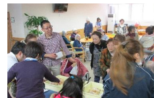
さやのちゃんのパン