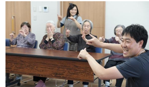
地域のお茶の間 みなみ支援センターの脳体操！