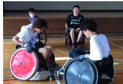
道内唯一の車いすラグビーチーム 道都大学生と交流♪