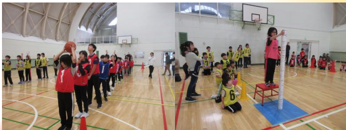
新春ファミ体 運動会 成績

1月4日(日)にファミリー体育館でミニ運動会を実施しました。子どもたちの32名が参加し、赤チーム・黄チームの2チームに分かれて団体競技を行いました。