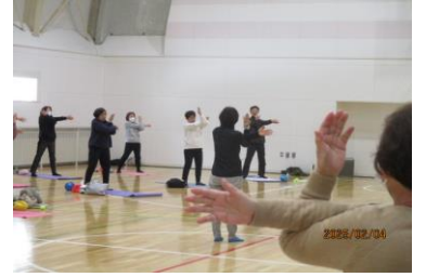
いきいき冬の運動会 2/2