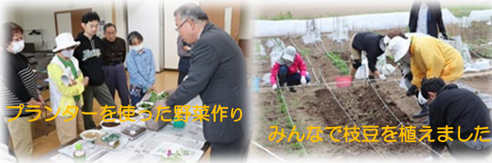
プランターを使った野菜作り