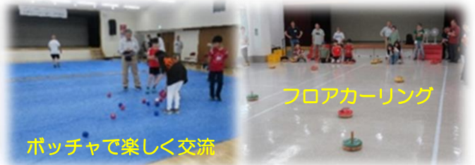
ポッチャで楽しく交流