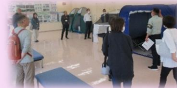
1, 防災教室の内容は・・・ (満足度1~10点満点)6点