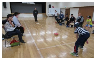
フロアカーリングの様子