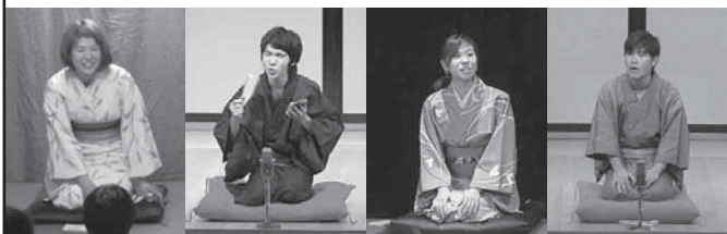
北大亭新人 遊子家悲志 鳳亭小柑 いだけ家大志