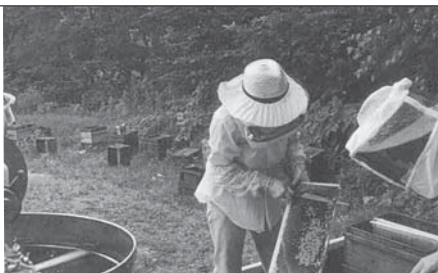
市内の蜂場で蜂蜜を採集する様子

市内で採れるのはアカシアやクローバー、百花（ミツバチが多種類の花から集めた蜂蜜）の3種類。アカシアは爽やか、クローバーは濃厚と、花によって味が異なります。そのまま飲食したり、梅漬けに使うなど、用途はさまざまです。