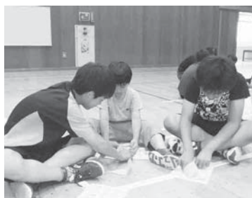
平和折鶴集會の様子

今年度の大曲東小学校児童会は、「笑顔で元氣よく、あいさつをする活動」「いろいろな学年と仲良くなる活動」「きれいで、みんなが気持ちよく生活できる活動」「ボランティア活動」を重点としています。 「笑顔で元氣よく、あいさつをする活動」は生活委員会が「挨拶ミッション」を行い、「きれいで、みんなが気持ちよく生活できる活動」は美化委員会が「ゴミ拾いミッション」というように、各委員会がアイデアを出し協力し合っています。「いろいろな学年と仲良くなる活動」は、今年から縦割り掃除をすることになり、ほかの学年との交流が増えました。また、「平和折鶴集會」では、高学年が低学年に折り鶴の折り方を教える場面もあります。 このほかにも、仲良し運動、運動ミッションなどの活動もあります。これからもいろいろな企画を通して、友達の輪が広がって、全校児童542人が力を合わせて笑顔で過ごせる学校にしていきたいと思えます。