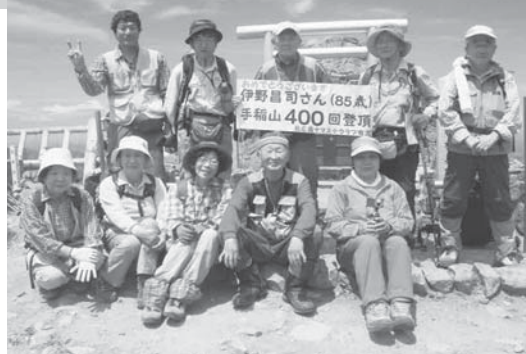
手稲山山頂で、仲間と400回登頂を祝った