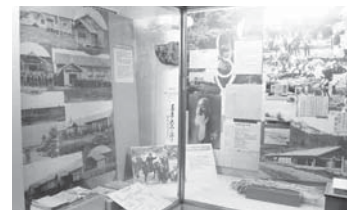
郷土展示コーナー

読書室 学生などに開放し、学習できる部屋です 調査室 社会人向けに開放し、インターネット回線はありませんが、パソコンを持ち込んで利用できます AVコーナー 映像資料が閲覧できる個人ブースと、CD・DVDが視聴できるオーディオブースがあります。インターネット端末も使えます AVサロン 毎週水曜に映画上映会を開催しています。日程や内容は、毎月本紙1日号に掲載しています（今月号は17ページです） 郷土展示コーナー 北広島市の歴史がわかる年表や資料が展示されています