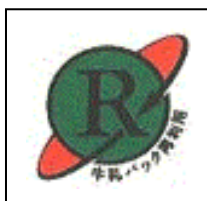
牛乳パック 再利用マーク