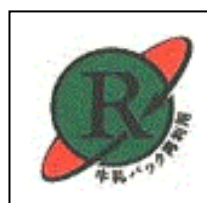
牛乳パック 再利用マーク