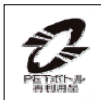
PET ボトル再生 利用マーク