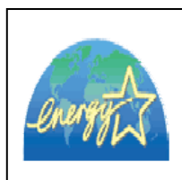
国際エネルギー スターロゴ