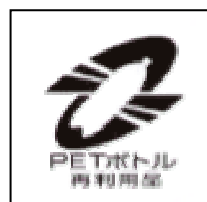
PET ボトル再生 利用マーク