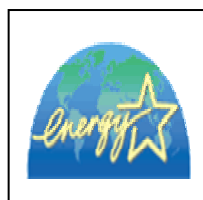
国際エネルギー スターロゴ