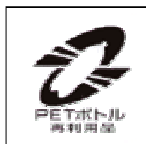
PET ボトル再生 利用マーク