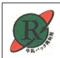
牛乳パック 再利用マーク