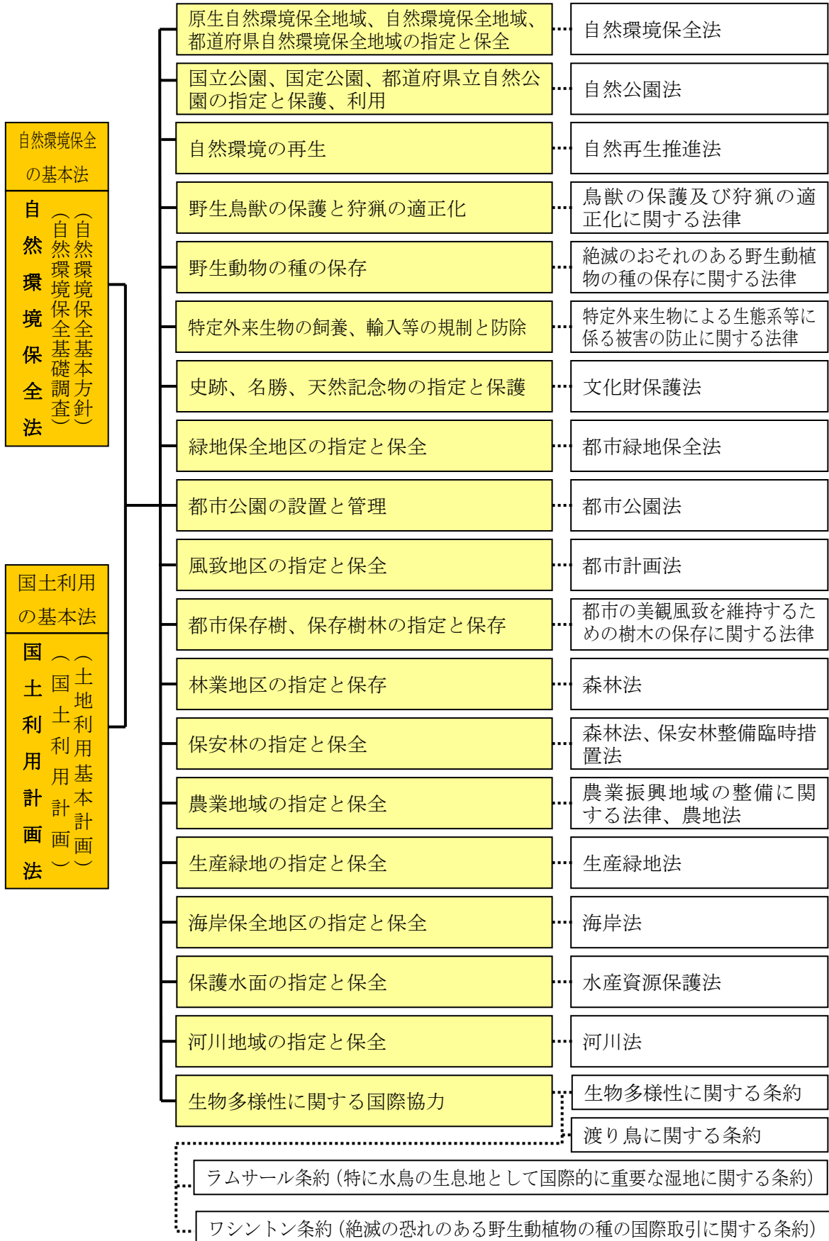
図 9-1 自然環境保全制度の体系図