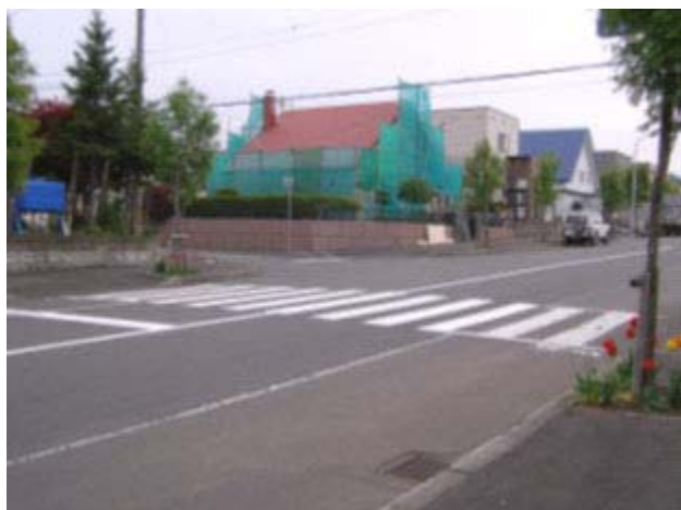
番号 若葉小学校点検個所