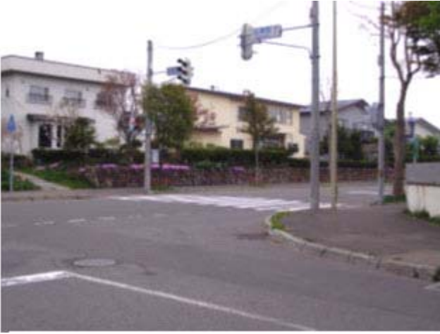
番号 広葉小学校点検箇所