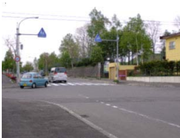
番号 高台小学校点検個所