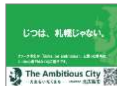
ポケットティッシュ