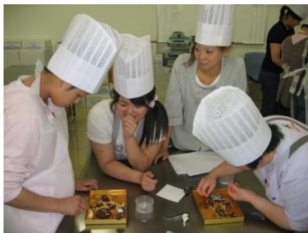
* 石屋製菓でのクッキー作り