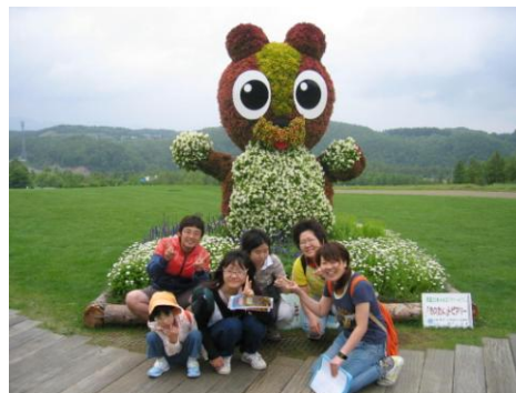
* 滝野すずらん丘陵公園