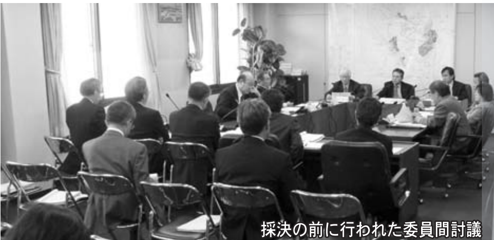
採決の前に行われた委員間討議