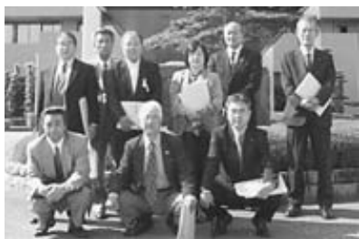
総務常任委員会(三好町)

IT戦略計画を策定し、電子申請・届出システム・健診予約システム・電子入札・建設CALS/ECの導入など、市民や事業者への情報提供・共有を実施。