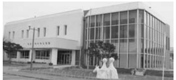
老朽化が進んでいる中央公民館

答 新たな施設建設は、市の財政に大きな負担を伴うので、現施設の改修と維持管理に努める。中央公民館は、防衛施設局の民生安定補助事業を財源として、22年度補助を要望、23年度に実施計画、24年に大規模改修を検討している。