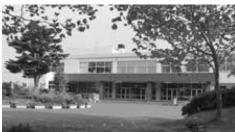
学校統合後の利用は課題が多い

問 「この施設を取り壊し新たな施設として代替」「民間に売り地区の活性化」「既存校舎をそのまま利用」なども検討するのにか 答 基本的に「校舎などは可能な限り有効利用」「公共施設としての利用」「全市的な視点」「団地の活性化」などの検討をする。