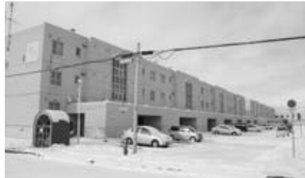
条例の一部改正が予定されている市営住宅

問 10月末現在、道と110の市町村が住宅条例を改正し、暴力団員の入居を制限。既に入居を断った例が4件あり、効果を発揮しているが、本市は、条例等で暴力団員の入居を排除する措置を取っているのか。