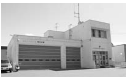
移設が急がれる消防大曲出張所