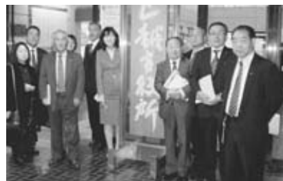
民生常任委員会(上越市)

保健・福祉・介護の拠点である「元気館」で子育て支援事業の一つであるさらさら講座について視察。この施設は保健師・栄養士・保育士・精神保健相談員・理学療法士・歯科衛生士等が配置され、サポート体制が確立されている。