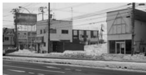
活性化が望まれる東部地区

答 市が策定した各種の計画を確実に効果的に推進するため、具体的なスケジュールや手法を示して