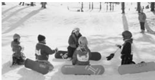
体育協会主催の子どもスノーボード教室

答 2月開催予定の「インドア子ども相撲大会」や「シニア健康運動講習会」、「ノルディックウォーキングセミナー」のほか、歩くスキーの貸し出しや市内スキー場助成券の配布などを行っている。