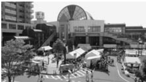
ふるさと祭りに集客を

答 事業主体である観光協会とどの様な制度がとれるか、どう活用できるのか、今後相談していきたい。