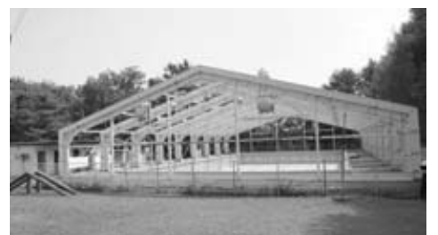
旧西部小用地にある西部プール

委員会としてはこの土地が現在教育財産であることから、理事者側に対して、プールの用途廃止後、普通財産へ移行する時期はいつ頃かとの質疑に対して、この土地は教育委員会が用途を廃止した時点で市長部局へ返還するが、平成23年度の予定であるという答弁がありました。審査の結果、総意をもって、趣旨採択すべきものと決しました。