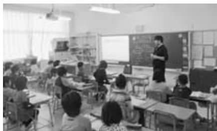
プロジェクターを活用した授業