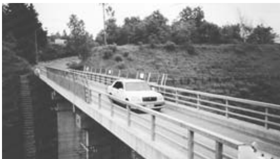
劣化が激しい農場橋