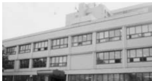
存続が危ぶまれる道立衛生学院

人いる准看護師が正看護師になるための道が閉ざされてしまう恐れがあるためとの説明がありました。