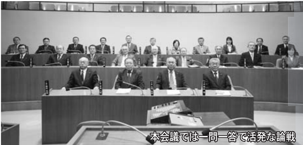
本会議では一問一答で活発な論戦