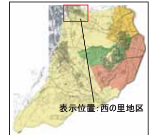
表示位置：西の里地区