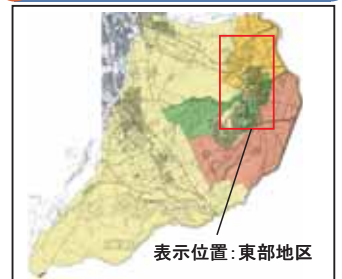
表示位置：東部地区